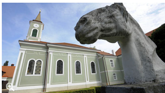
Národní hřebčín Kladruby nad Labem

Starokladrubský kůň, vyšlechtěný ze španělských a staroitalských koní, je jediné původní české plemeno, patří navíc mezi nejstarší dochovaná kulturní plemena na světě. Koně z Kladrub využívá i česká jízdní policie. Současní koně - je jich zhruba pět stovek - mají v hřebčíně evidované předky až do poloviny 18. století.