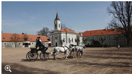
Komnaty císaře Františka Josefa I. nebo kočár z pohádky Tři oříšky pro popelku, to a více nabízí Kladrubský hřebčín

Druhá rána přišla v roce 1918, kdy se revoluční nechuť ke všemu habsburskému obrátila i proti koním z bývalého dvorního hřebčína. Pro chov se podařilo udržet pouze stádo běloušů, méně ušlechtilí vraníci byli odsouzeni k postupné likvidaci. Novým účelem hřebčína se nakonec stala produkce plemenných hřebců pro jednotlivé zemské chovy. Z bývalých rakouských hřebčínů se sem pro tento účel dostali zástupci anglických a anglo-arabských plnokrevníků i tři ročníky lipicánských hříbat.